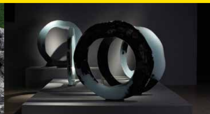
Perrin&Perrin, Eight