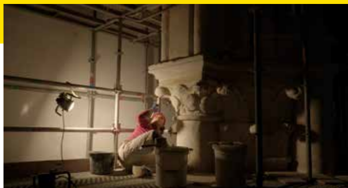
Chartres, la lumière retrouvée