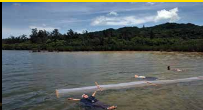
Au fil du monde. Japon

Le Trésor d'Angoulême , de Gilles Coudert & Damien Faure France, 2016, documentaire, 52'