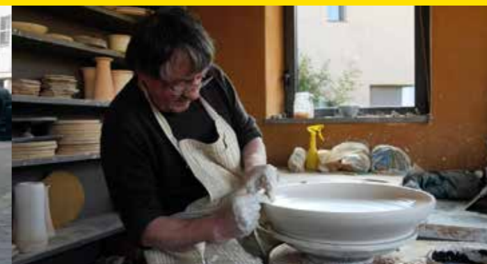
Yohen, l'univers dans un bol

Davide Rivalta, lo sguardo dell'innocenza , d'Elena Maticena Italie, 2015, documentaire, 29'