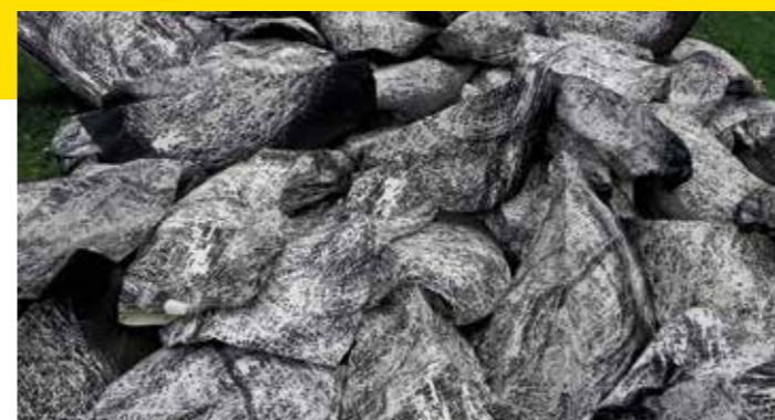
Roby Comblain, Scenolino © Roby Comblain

Né en 1962 en Espagne, Joan Crous est actif sur la scène artistique du verre contemporain depuis la fin des années 1980. De première formation en archéologie et histoire de l'art, Joan Crous est aujourd'hui à la fois artiste, enseignant et auteur d'ouvrages. Joan Crous s'est notamment fait connaître pour ses tables dressées entièrement réalisées en verre, témoignages d'un repas passé entre convives invités par l'artiste. L'une d'entre elles, d'une dimension de plus de 4 mètres de long, sera présentée à l'occasion de l'exposition.