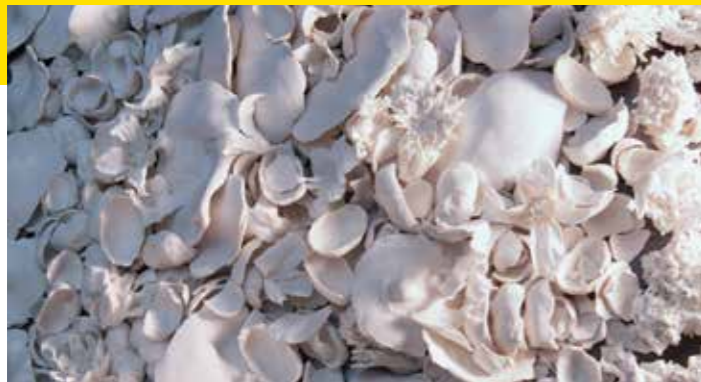
Noevus © Samuel Yal