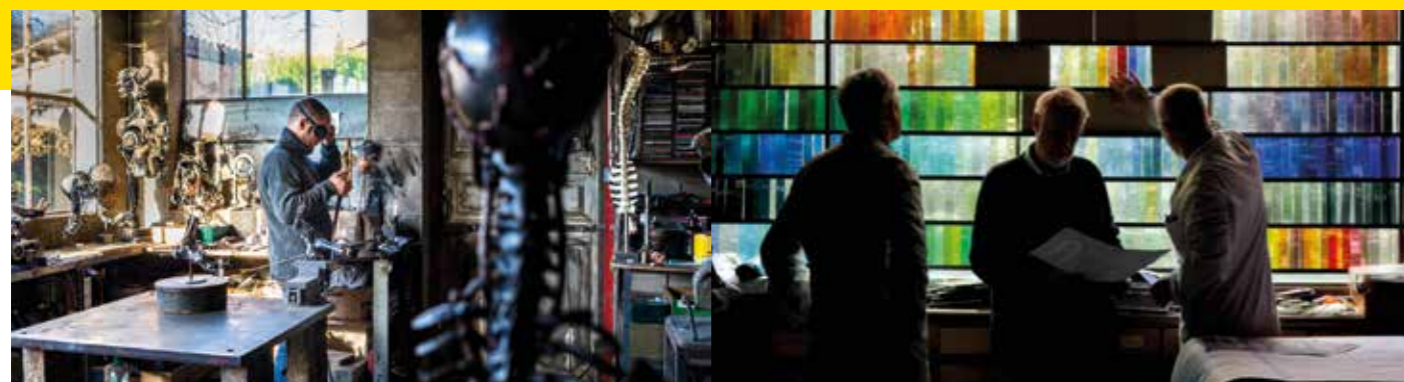
À fleur de peau