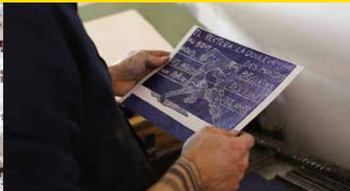
De papier et de plomb © Marie-Claude Fournier