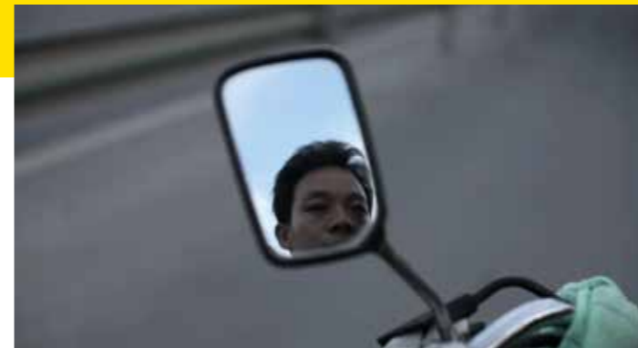
Li © Yu Chen

Fort de cet héritage, Est Ensemble, co-organisateur du FIFMA, déploie une politique ambitieuse d'accueil et de soutien aux métiers d'art et de création et à ces savoir-faire qui contribuent par leur rayonnement à la richesse du territoire, à sa valeur ajoutée, sa mixité et, ainsi, à son identité.