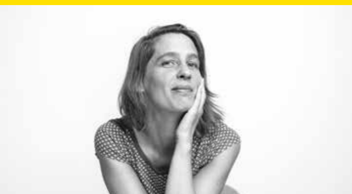
Aude Tahon © Julien Cresp