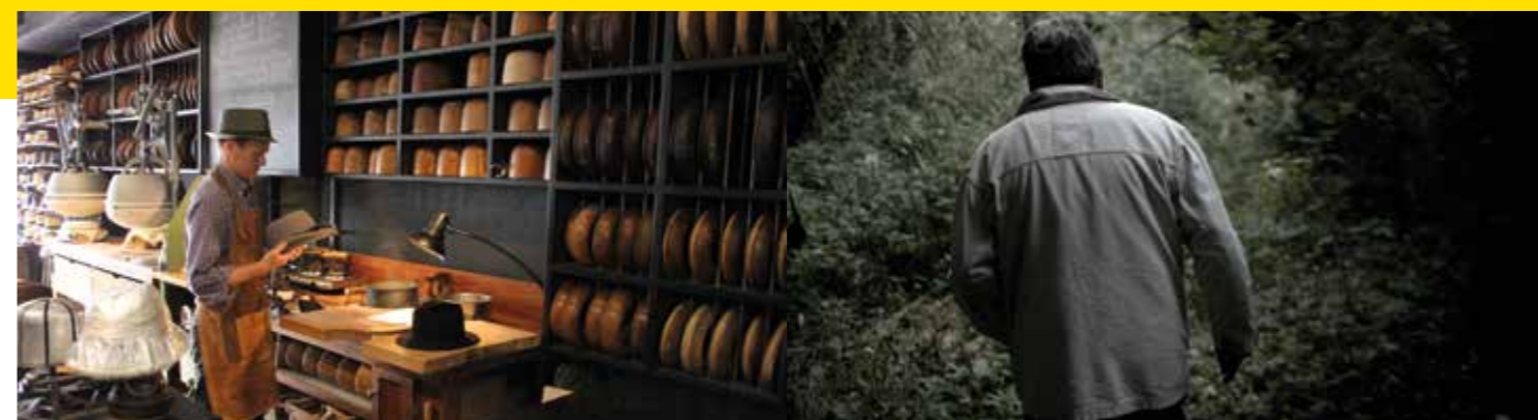
La folie du chapeau