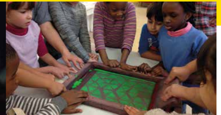
Atelier de sérigraphie textile