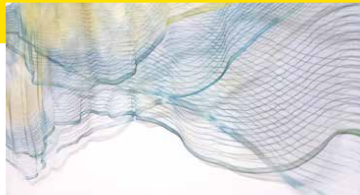
Ysabel de Maisonneuve, Still Waves