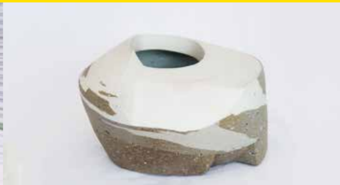
Les Manning, Landscape vessels