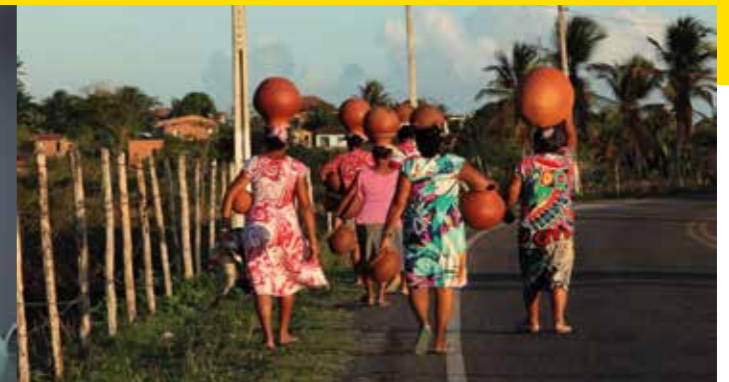
Faïencières © Alexandre Nunis